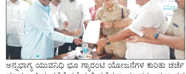
ಅನುಭಾಗ್ಯ ಯುವನಿಧಿ ಭೂ ಗ್ಯಾರಂಟಿ ಯೋಜನೆಗಳ ಕುರಿತು ಚರ್ಚೆ ಮಾಡಲಾಯಿತು ಕಳೆದ ಸಭೆಯಲ್ಲಿ